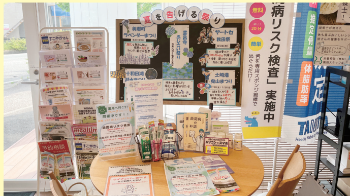
店内のインフォメーションスペースでイベントを紹介

ラベンダー薬局では、歯周病リスク検査(アドチェック)の体験会を期間中10名限定で行うとともに、通常有料で行っている体組成計での筋肉量・骨量の測定を無料で行った。