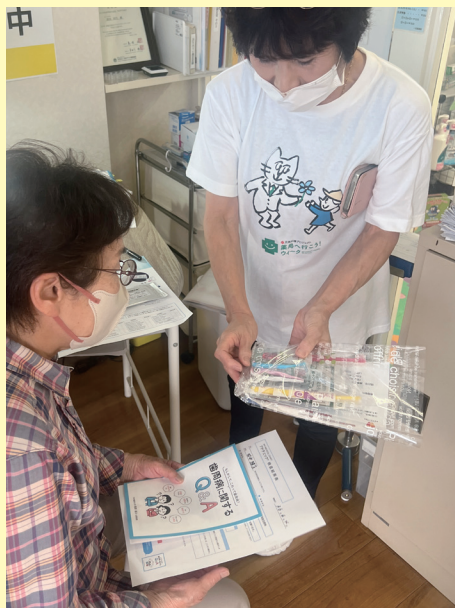
体験者には歯周病対策キットをプレゼント