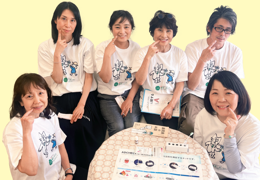
オリジナルTシャツをお揃いで着用し、イベントを楽しく盛り上げる